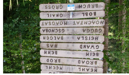
WANDERREITEN RUND UMS RIES - Diakpass am Grenzweg