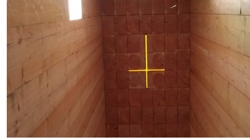
WANDERREITEN RUND UMS RIES - Kreuz aus Bernsteinglas