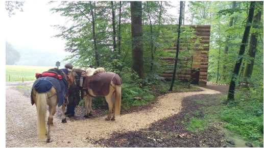
WANDERREITEN RUND UMS RIES - Baumstamm-Kapelle

Ende der Tour WanderReitbetrieb Hof Kranichau