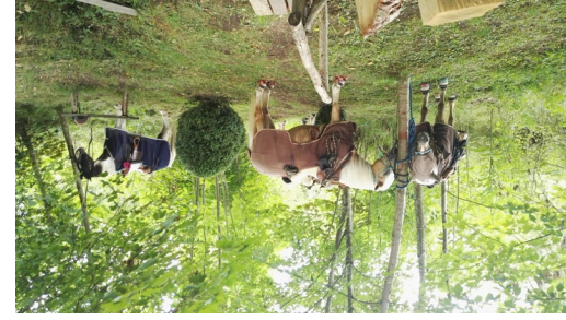
WANDERREITEN RUND UMS RIES - Am Kesselursprung