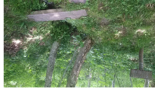
WANDERREITEN RUND UMS RIES - Kesselursprung